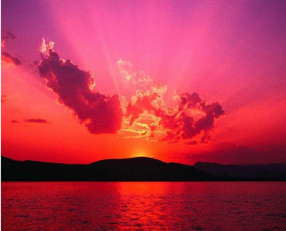
Εικόνα 4.1: Άποψη της περιοχής δειγματοληψίας